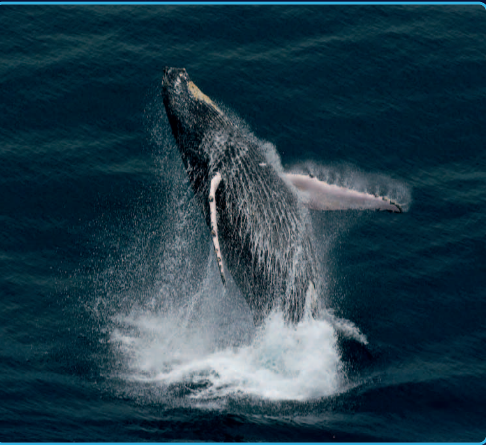
Baleine au large de Port-Gentil, province de l'Ogooué-Maritime, Gabon [0°32' S - 8°52' E].