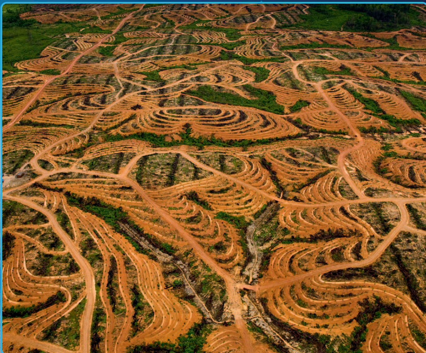
Nouvelle plantation de palmiers à huile près de Pundu, Bornéo, Indonésie (1°59' S - 113°06' E).