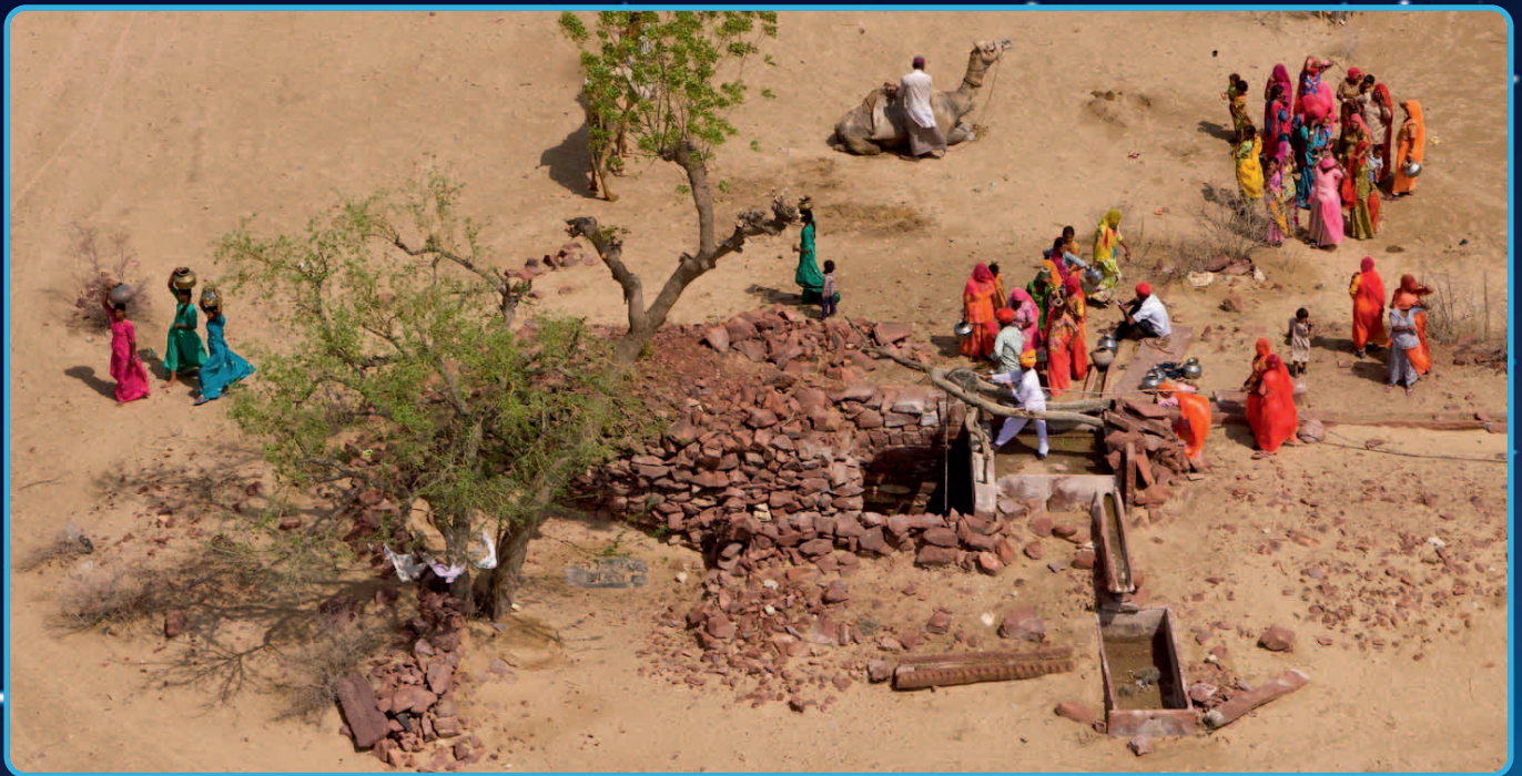
Femmes au puits près de Khudiala, Rajasthan, Inde (26°26' N - 72°40' E).