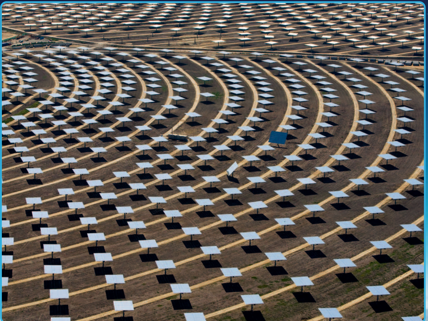
Centrale solaire thermoélectrique de Santlúcar la Mayor, près de Séville, Andalousie, Espagne [37°26'N - 6°15'O].