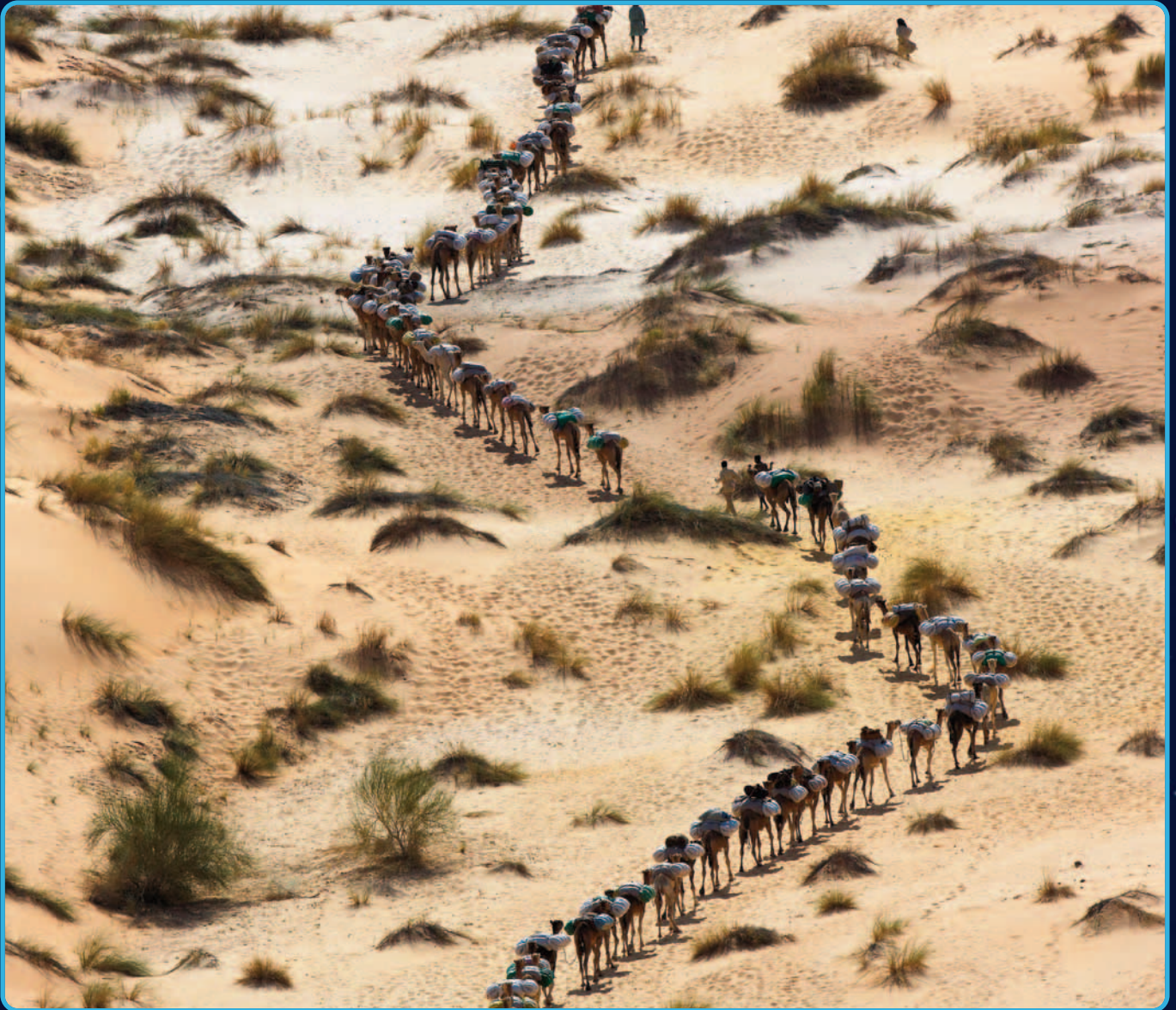
Caravane de dromadaires près de Tichit, Mauritanie (17°29'N - 9°06'O).