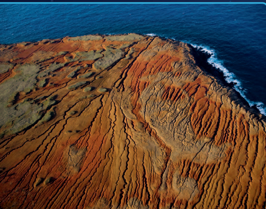
Brise-glace Louis-Saint-Laurent dans Resolute Bay, Territoire du Nunavut, Canada (74°42' N - 95°18' O).

Une prise de conscience, liée à la force de conviction et à l'émotion suscitée par les images de Yann Arthus-Bertrand. Si j'en crois le succès du livre La Terre vue du ciel , le degré de sensibilisation du public sera exceptionnel quant à l'état de la planète et à la nécessité d'agir à l'échelle individuelle et collective. L'idée est vraiment de faire en sorte que les gens bougent.