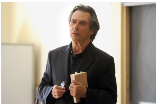
Auguste / Sami Frey