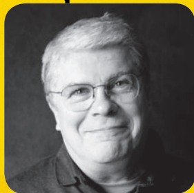
© CH. ROBIN - LE LOMBARD 2011