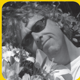
© DR - LE LOMBARD 2011